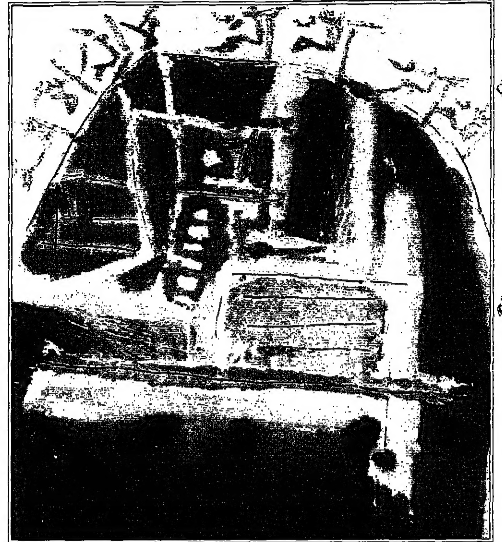
من أعمال الفنان مارجو سوكاتمو